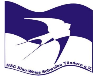
III. Tabelle Gruppe 1